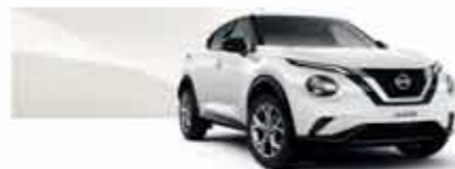
Blanc Lunaire (MS) - QAB