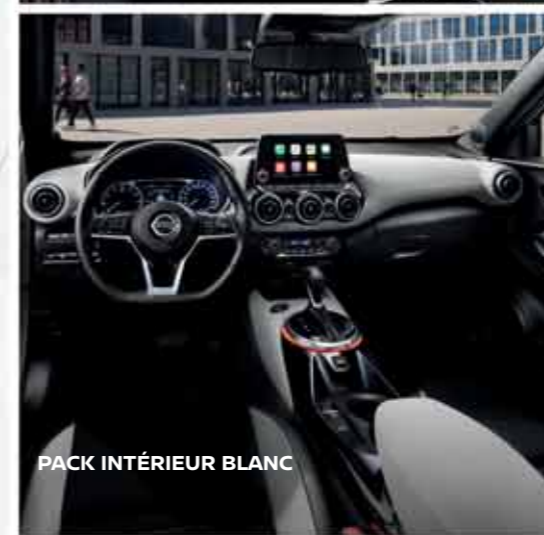
PACK INTÉRIEUR BLANC