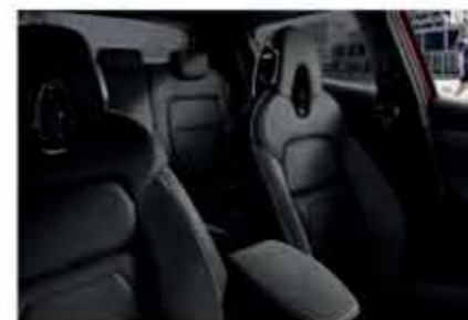
N-DESIGN PACK INTÉRIEUR NOIR Sellerie Perso Noir : sellerie Cuir/Alcantara®