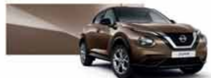
Bronze Intense (M) - CAN