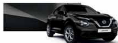
Noir Métallisé (M) - Z11