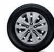
Acier 16" (avec enjoliveurs)