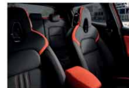
N-DESIGN PACK INTÉRIEUR ORANGE Sellerie Perso Orange : sellerie Cuir/TEP*