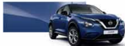
Bleu Indigo (M) - RBN