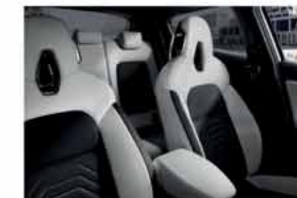
N-DESIGN PACK INTÉRIEUR BLANC Sellerie Perso Blanc : sellerie mixte TEP*/Tissu