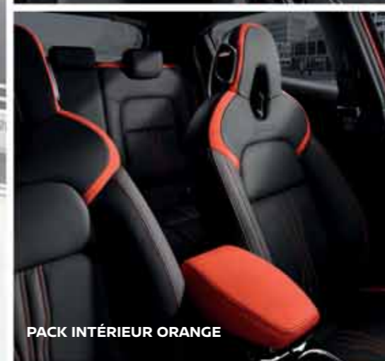
PACK INTÉRIEUR ORANGE