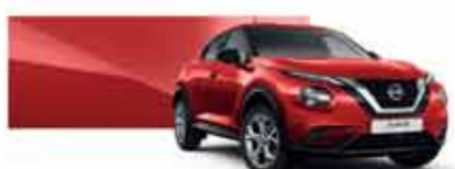
Rouge Toscane (O) - Z10

MS = Métallisée spéciale M = Métallisée O = Opaque