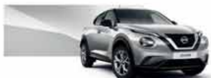
Gris Perle (M) - KYO