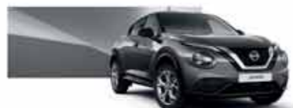
Gris Squalé (M) - KAD