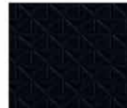
VISIA & ACENTA Sellerie Tissu Noir