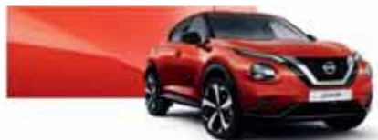
Rouge Fuji (MS) - NBV