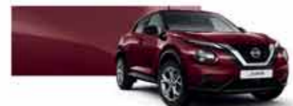
Rouge Passion (MS) - NBQ