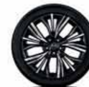
Alliage 19" AKARI