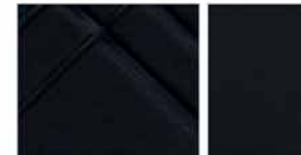
TEKNA Sellerie mixte TEP*/Tissu