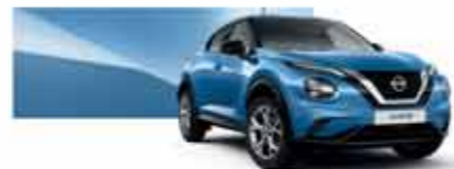
Bleu Topaze (MS) - RCA