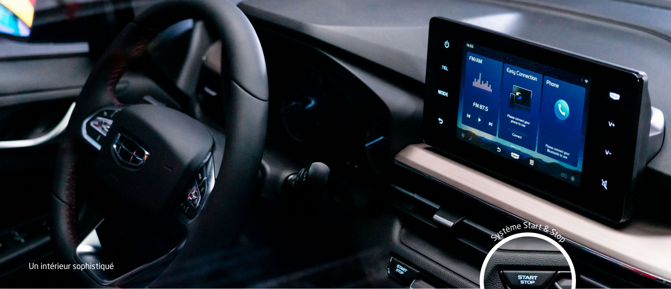
Un intérieur sophistiqué