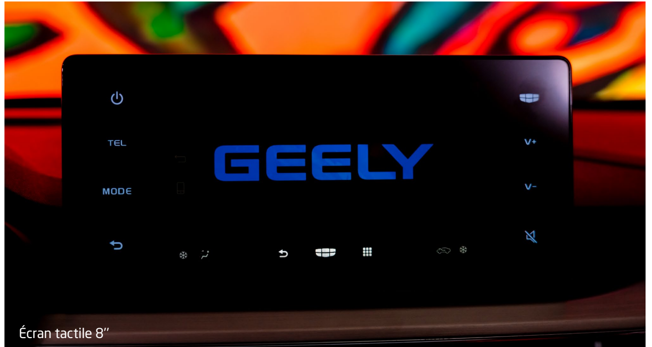
Écran tactile 8"