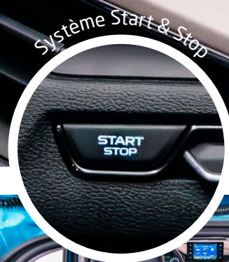
Système Start & Stop