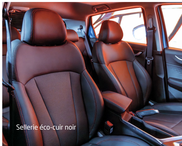
Sellerie éco-cuir noir