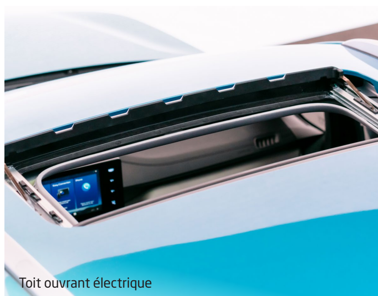
Toit ouvrant électrique