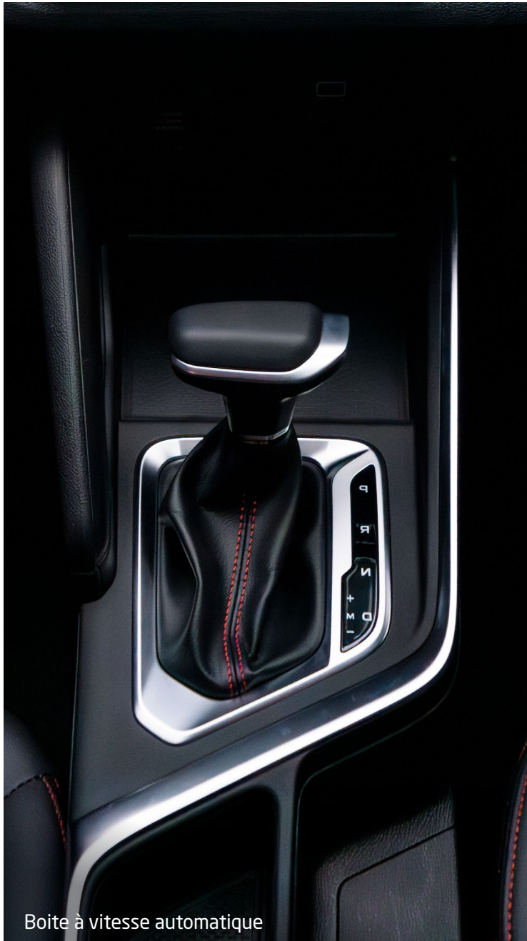
Boîte à vitesse automatique