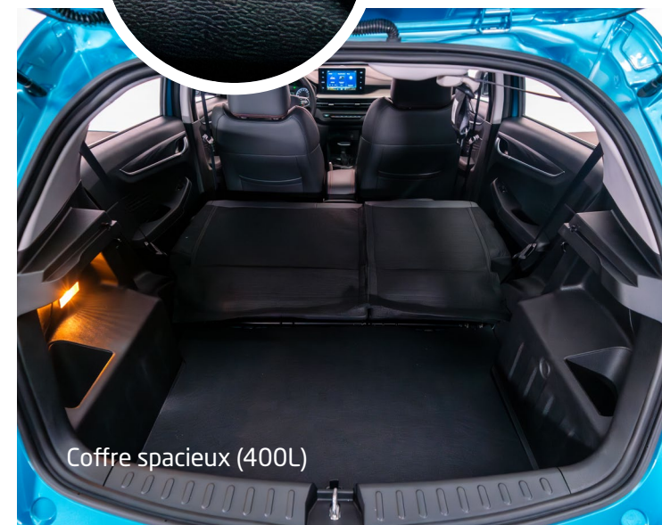
Coffre spacieux (400L)