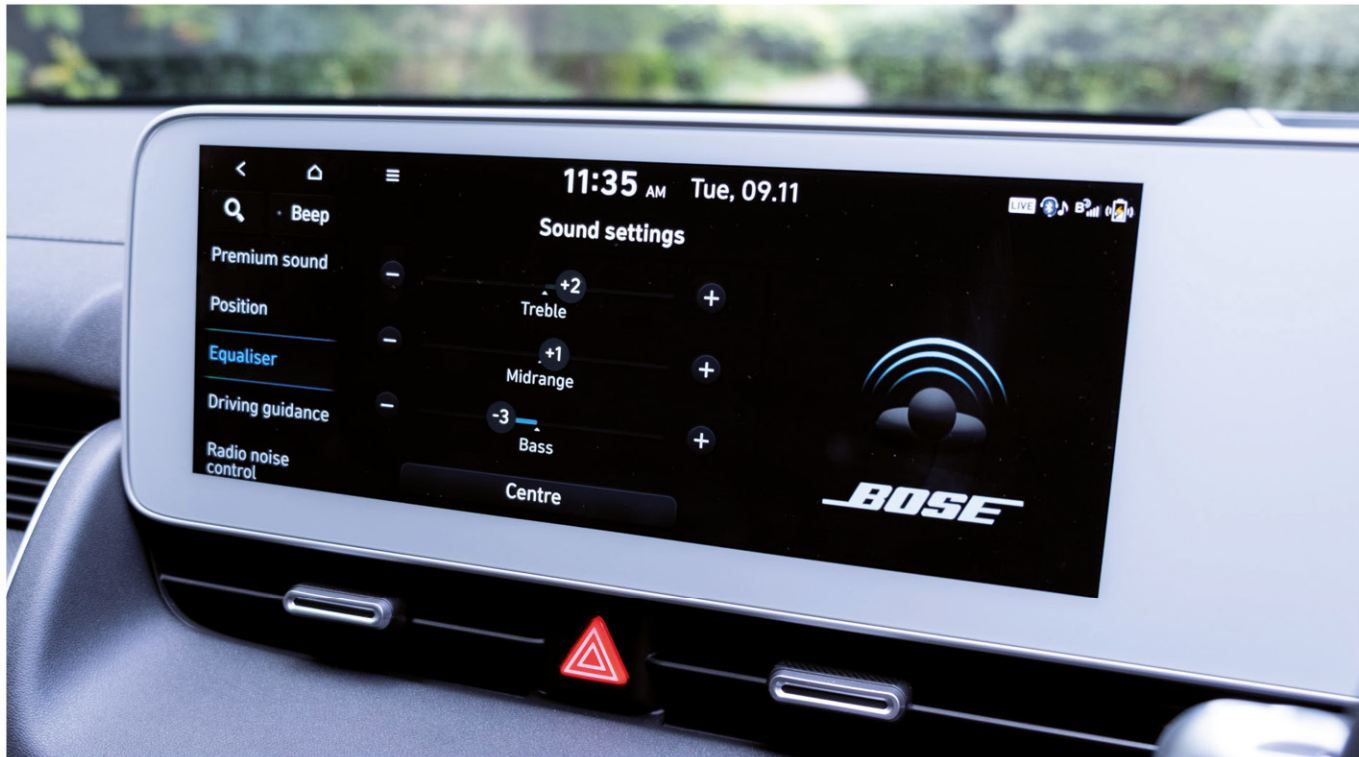
Système multimédia avec écran couleur tactile 12,3" avec reconnaissance vocale.

Apple CarPlay™ est une marque d'Apple Inc. Android Auto™ est une marque de Google Inc.