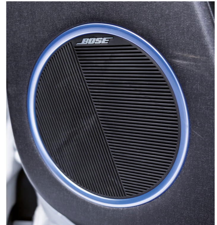
Système audio premium Bose®.